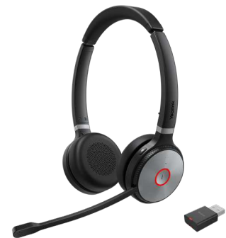
WH62 Dual Portable Teams WH62 Dual Portable UC

Hundert Kopfform-Bewertungen und tausenden Tragekomforttests zufolge erfüllt der WH62 nahezu alle ergonomischen Anforderungen. Mit erstklassigen weichen Lederpolstern und seinem leichten Design lässt er sich zudem den ganzen Tag bequem tragen. Und für mehr Bewegungsfreiheit beim Arbeiten lässt sich der WH62 auch mit bis zu 120 m Abstand vom Tisch entfernt einsetzen.