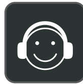
Tragekomfort für den ganzen Tag