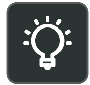
Sichtbares Busylight Busylight